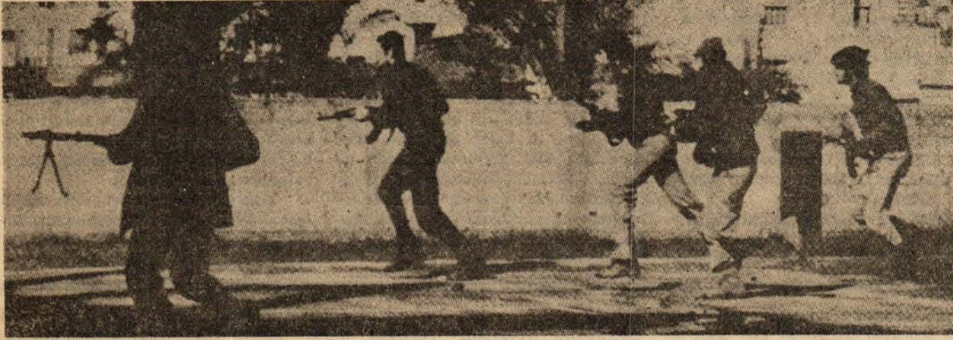
Solcu Müslüman gerillalar bir saldırı sırasında

Lübnan'daki sınıflar arası iç savaş Lübnan ordusu ve Filistin gerillalarının da katılması ile daha da büyük boyutlara ulaştı. Beyrut sokaklarında ve Lübnan'ın diğer kentlerinde göğüs göğüse, sokak sokak, ev ev, bina bina korkunç bir savaş, günümüzün en büyük iç savaşlarından biri sürüp gidiyor ve daha uzun süre