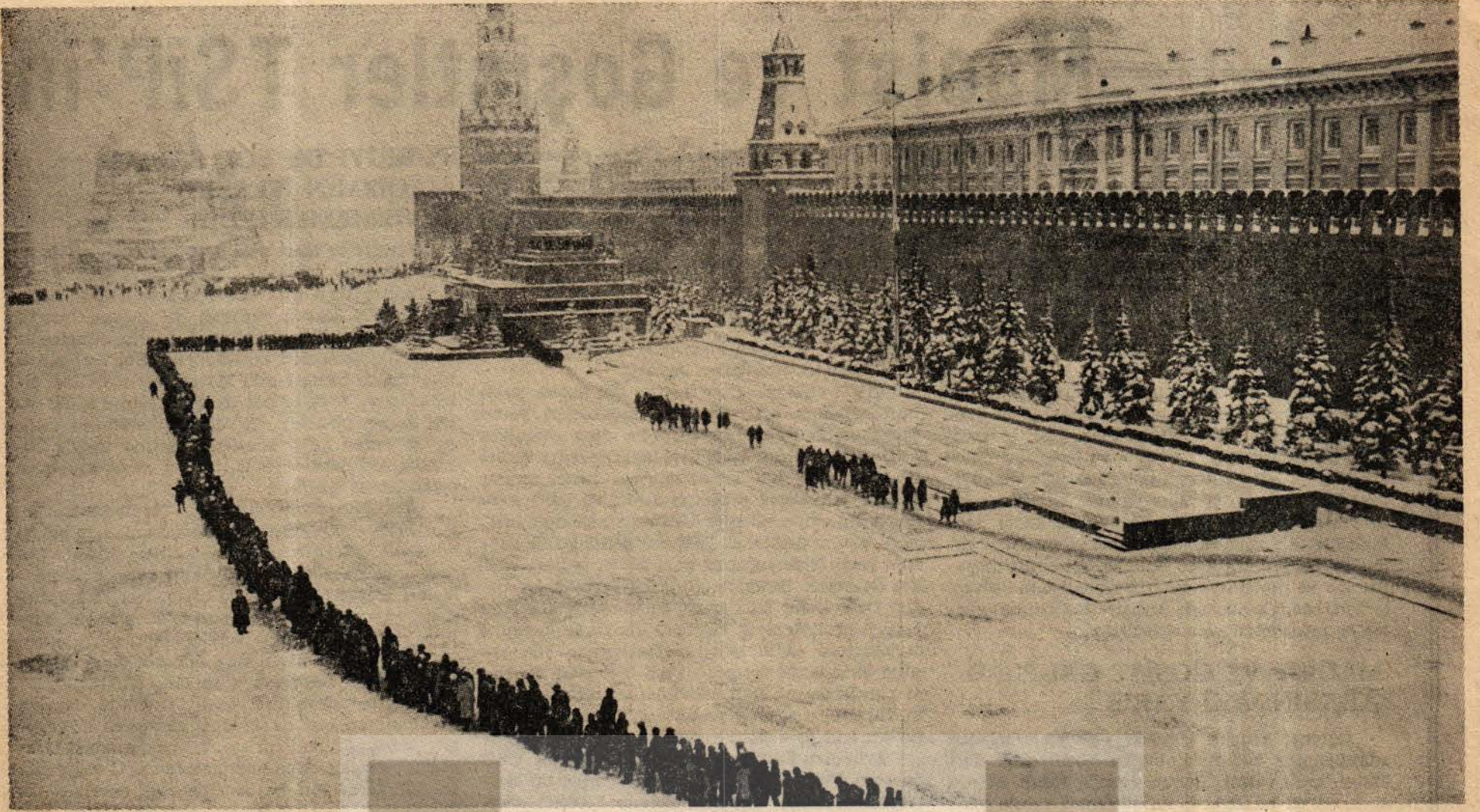
Her gün onbinlerce kişi, insanlığın kurtuluşunun bayrağı Lenin'i görmek için Kızılmeydan'da sıraya giriyor.

tiğin bütünselliğinden başka birşey olmadığını gösterdi.